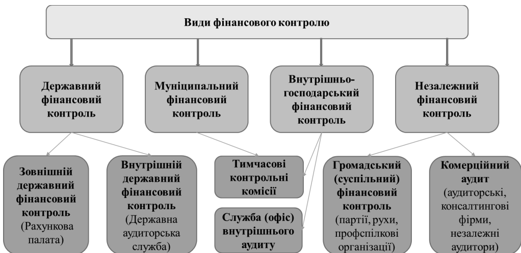
Рис. 1. Види фінансового контролю як комплекс професійних контрольних-перевірочних заходів за суб'єктами здійснення

Державний фінансовий контроль займає ключову позицію серед інших видів фінансового контролю (рис. 1) і відіграє важливу роль у захисті інтересів держави та суспільства у сфері надходження та використання державних коштів. Належна організація такого контролю впливає на напрямки економічного розвитку країни, добробут населення, а також масштаби тіньової економіки та економічної злочинності.