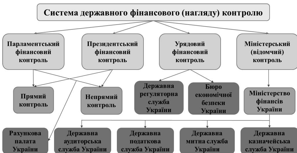
Рис. 2. Система органів державного фінансового контролю в Україні

Щоб здійснити належний аналіз результатів державного фінансового контролю в Україні, необхідно з’ясувати як організована система державного фінансового контролю в країні (рис. 2).