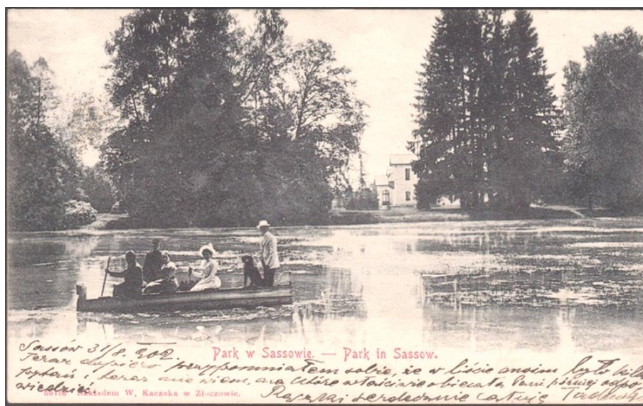
Рис. 3. Парк зі ставом у Сасові на початку XX ст. [6].

Як виглядав парк зі ставом, на якому також можна було поплавати на човні, можемо побачити на листівці, відправленій паном Тадеушем у 1902 р. до своєї знайомої у Краків (рис. 3).