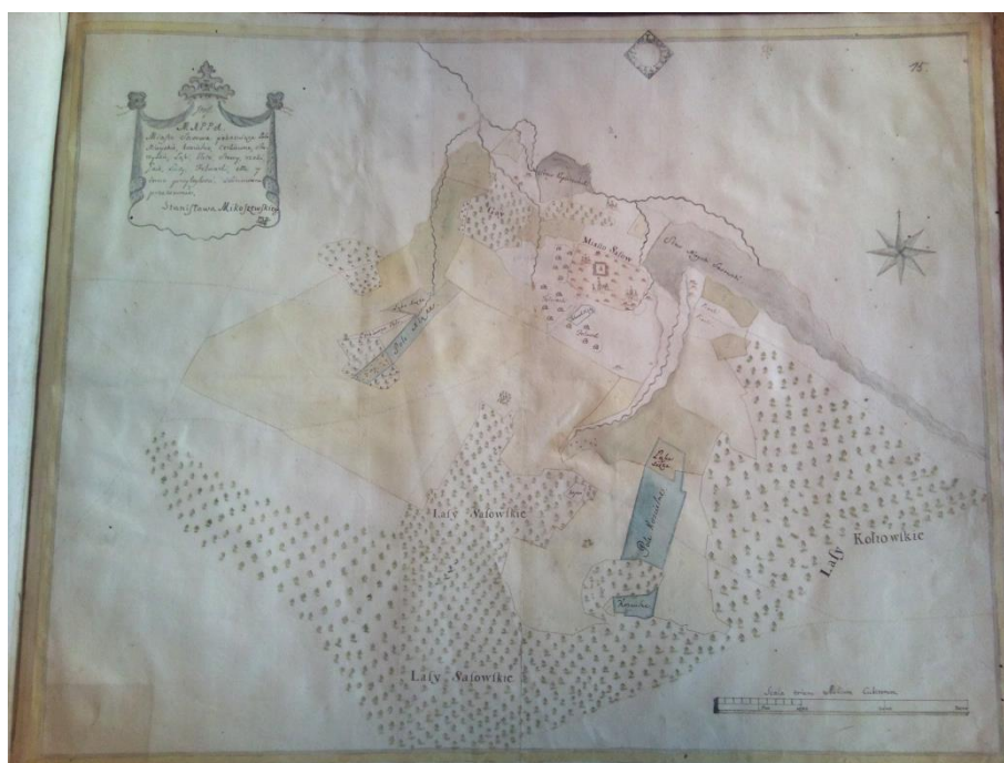
Рис. 4. Карта земель міста Сасів, середина XVIII ст. [7]. Fig. 4. Map of the lands of the city of Sasiv, mid-18th century.

Ще в період Речі Посполитої, в 1759 р., виконано декілька карт сіл Золочівського повіту Львівської землі Руського воєводства, що належали князям Радзивіллам (у цей час Сасів теж був у їхній власності). На картах позначено межі населених пунктів, а також площі лісів, гаїв, полів, луків, поселень і інших об'єктів. Цю масштабну роботу виконав присяжний геометр Станіслав Мікошевський (gysowane przez Stanisława Mikoszewskiego Komornika Granicznego Wiskiego Geometry Przysięgłego) (рис. 4).