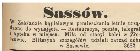
Рис. 1–2. Реклама бальнеологічного закладу в Сасові, 1883 р. – справа, 1891 р. – зліва [15, с. 8; 17, с. 9].